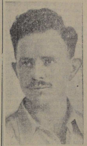
הקצרות יותר מעשועה אדם רגיל כל ימי חייו. אימרה זו נכונה לגבי ישי ז"ל, מפקד אצ"ל שנספה לפני שנה, ערב יום כיפור תש"ט. בתאונת'דרכים

מתוקה שנת העובד אם מעט ואם הרבה יאכלי - את הפסוק הזה דרשו חז"ל על תלמיד חכם צעיר שנפטר לפני הגיעו לשנתו השלושים. אותו ה"ח - אמרו חכמינו - הספיק לעי שות מעשים טובים משך שעות'הלדו