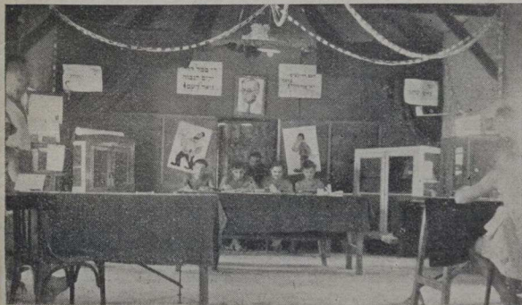
חדר התרבות בלטרון